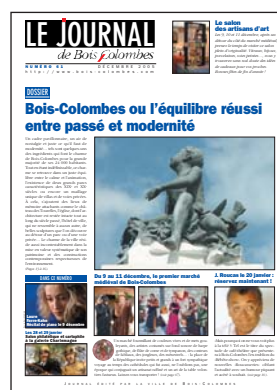
LES SUPPORTS DE COMMUNICATION AU SERVICE DES ARCHIVES