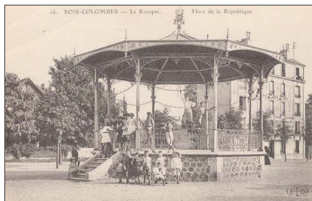
CARTE POSTALE DU KIOSQUE À MUSIQUE VERS 1900