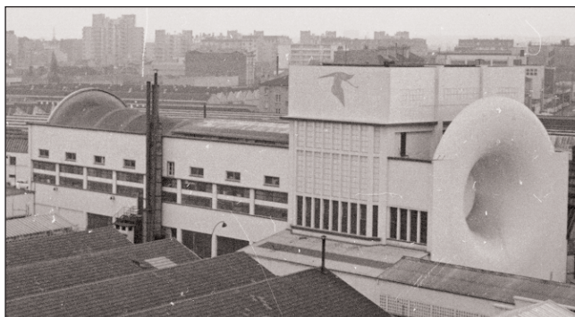
LA SOUFFLERIE DE L'USINE HISPANO-SUIZA EN 1970